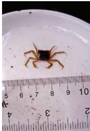
Tosti, het mannelijke Zuiderzeekrabbetje uit 2019.

Toen ik in 2010 het eerste exemplaar ontdekte, vroeg ik Naturalis om hulp bij de determinatie. Dat instituut was dólblij met de toendertijd allereerste waarneming in Leiden. Dit van oorsprong Amerikaanse mini-krabbetje is dan wel geen RAVON-dier, de telmethodes waarmee ze worden gevonden (3 exemplaren in 9 jaar) gebruiken we wél regelmatig voor het vissenmonitoren in de Leidse binnenstad: de eerste twee krabjes zaten op het kattenklimtuw en ‘Tosti’ werd gevonden met behulp van de grofvuilvismethode. Het kattenklimtuw biedt met zijn gedeeltelijke ligging onder het oppervlak ook een prima substraat voor andere kleine grachtbewoners, zoals rivierdonderpadden en hun favoriete voedsel: vlokreeften.