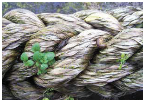
Zuiderzeekrabbetje en vlokreeft op kattenklimtuw, 2010.