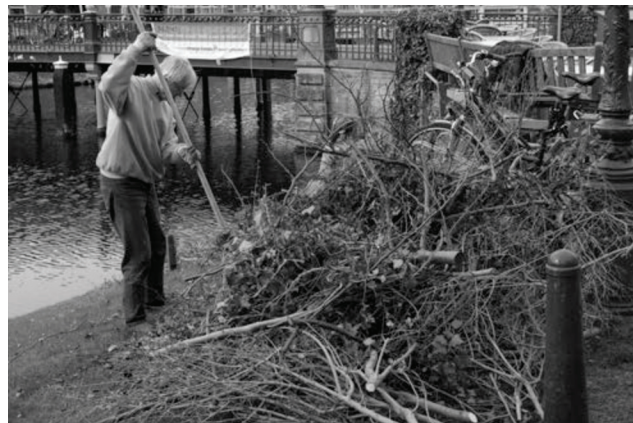
Vrijwilligers aan het werk op de Boisotkade, foto Sarah Hart

Op zaterdag 11 maart waren zo'n twaalf vrijwilligers op de Boisotkade actief in het kader van de landelijke actiedagen 'NL Doet'. Onder begeleiding van Singelpark-Vrienden met groene vingers en r tuingereedschap werd de lage begroeiing op het talud onder handen genomen. Daarmee is ruimte geschapen voor nieuwe beplanting en perken. (JWP)