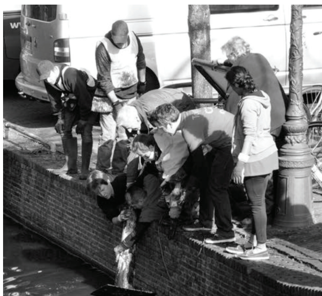
Het opvissen van een Leidenaar uit het Rapenburg