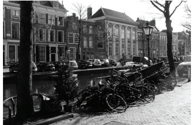
Een deel van de oogst van 10 maart

Aaf wil samen met de wijkvereniging de komende jaren ook andere grachten in onze wijk aanpakken. Dat gebeurt met steun van vele met ons water verbonden instanties zoals het Hoogheemraadschap, de afdeling Leiden van de Koninklijke Nederlandse Vereniging voor Veldbiologie, sportvissers, de diensten Handhaving en Inzameling van de gemeente en natuurlijk onze wijkbewoners.