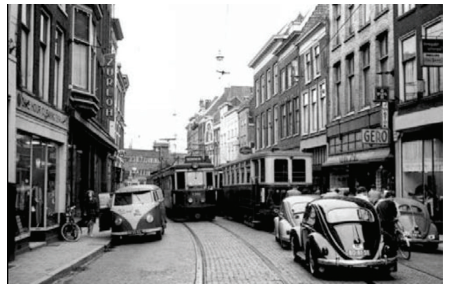
De Breestraat in 1961 met links Zürhlob

Zoals bekend wordt naar het ontwerp van architectenbureau Mulder Van Tussenbroek een groot gedeelte van dit blok gerestaureerd. Aan de Breestraat komt Albert Heijn. De voormalige stomerij, een gemeentelijk monument, krijgt een nieuwe onderpui, die het beeld oproept van de oorspronkelijke pui. De oude winkelpui van Zürloh krijgt de aanzet terug van het vroegere diepe portiek. In Breestraat 136, ook een gemeentelijk monument, werd de wandbetegeling van het voormalige portiek teruggevonden. Op basis daarvan, en de originele tekeningen is de originele, prachtige houten winkelpui gereconstrueerd. Het magazijn van Albert Heijn komt in het Asarti pand. Om geen lelijke magazijndeuren te krijgen aan de Breestraat is hier een volledig nieuwe pui ontworpen, die eruitziet als een winkel met etalage.