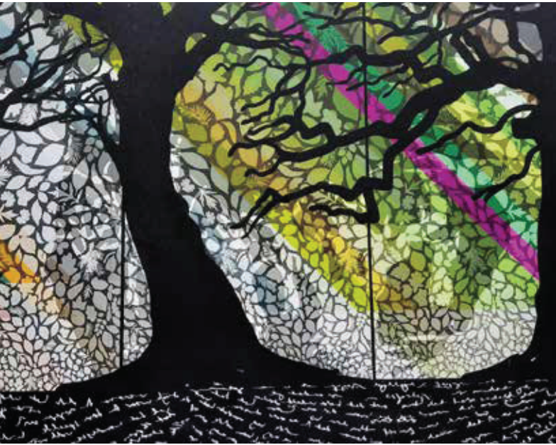
Ontwerp van het wandkleed

van 100 m2 in vier steden geborduurd wordt. In iedere stad wordt een pop-up atelier opgesteld waar vrijwilligers tien meter borduren. Iedereen kon er aan meedoen, ervaring was niet noodzakelijk. Het begon in de Centrale Bibliotheek in Den Haag in de winter van 2019/2020, in de lente werd het verplaatst naar Amsterdam in social design studio The Beach, in de zomer was het in de Hortus Botanicus in Leiden en nu wordt er in Enschede in De Museumfabriek gewerkt. Helaas is het werk op dit moment stopgezet, omdat de musea in verband met corona gesloten zijn. Hopelijk is dat tijdelijk. Uiteindelijk zal het resultaat in Museum Mesdag in Den Haag tentoongesteld worden.”