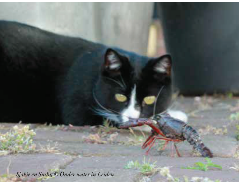
Sjachie en Susbi, © Onder water in Leiden

Zie de tips op zakgids.nl om met een sterke zaklamp veilig langs de oevers op pad te gaan. Ruim een half uur na zons- ondergang komen ze uit hun schuilplaats en kun je ze bij het zaklampvissen tegen de kademuren en over de bodem zien wandelen. Meer weten? Zie www.onderwaterleiden.nl . Reageren? info@onderwaterinleiden.nl . •