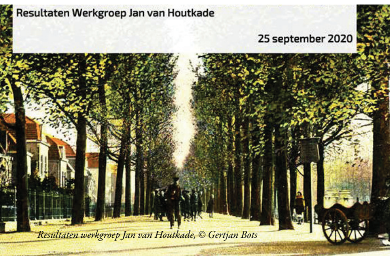
Resultaten werkgroep Jan van Houtkade, © Gertjan Bots