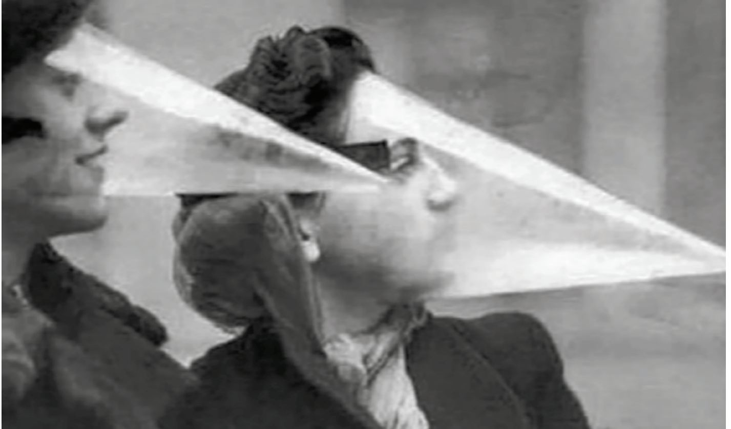
Bescherming tegen de Spaanse Griep in de VS rond 1920