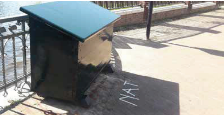
Verfbeurt van de zoutkist op de Vreewijkbrug bij Babbels

Projectleider Aaf Verkade is ook in de PAL-wijk regelmatig met stadswater gerelateerde activiteiten bezig. Ze kreeg van nieuwsgierige toeschouwers al gauw de vraag “mogen wij in onze wijk ook zo’n representatieve prent over onze eigen stadsnatuur? We weten nog wel een kist!” Daarop volgde dit voorjaar een serieus adoptieproces van twee zoutkisten op de Boisotkade. Ze zijn door een aantal omwonenden en Vrienden van het Singelpark ter hoogte van restaurant Babbels en het Regionaal Archief opgeknapt en van nieuwe lak voorzien. Deze winter kunt u het resultaat zelf bekijken, dan plaatst Onder water in Leiden de educatieve platen.